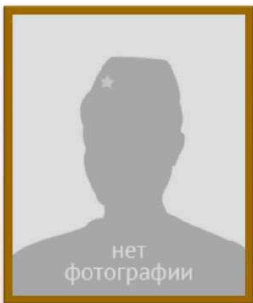
ГОРШЕНИН ФЕДОР ИЛЬИЧ