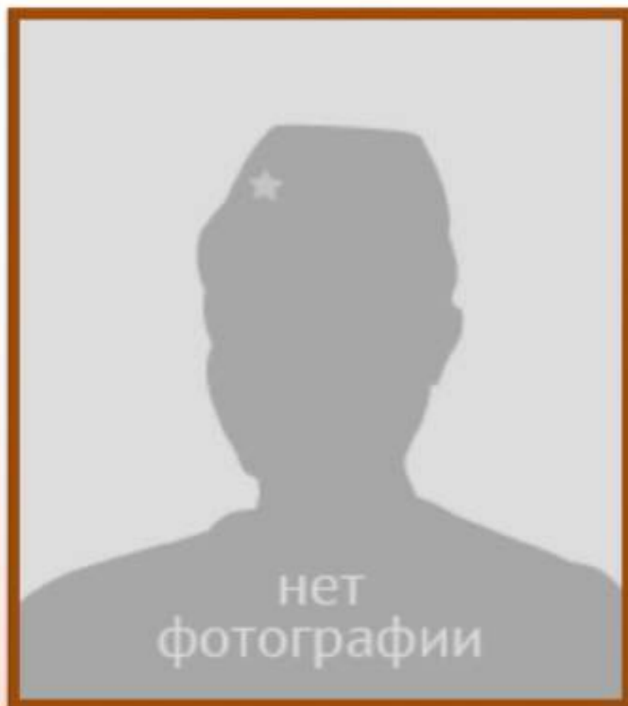
СКОБЕЛЕВ МИХАИЛ АЛЕКСЕЕВИЧ