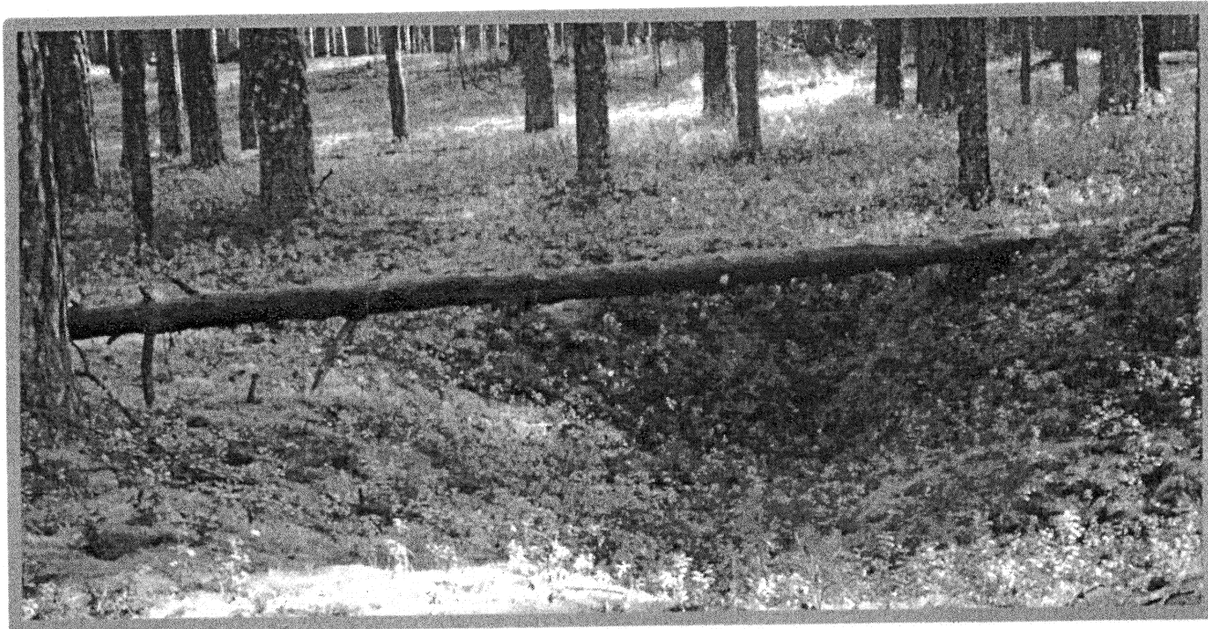
Изображение № 3 Валежник