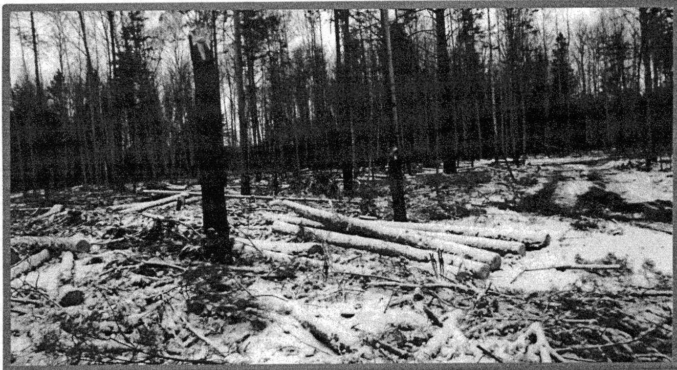
Изображение № 7 Брошенная древесина вдоль лесовозных дорог. Не является валежником