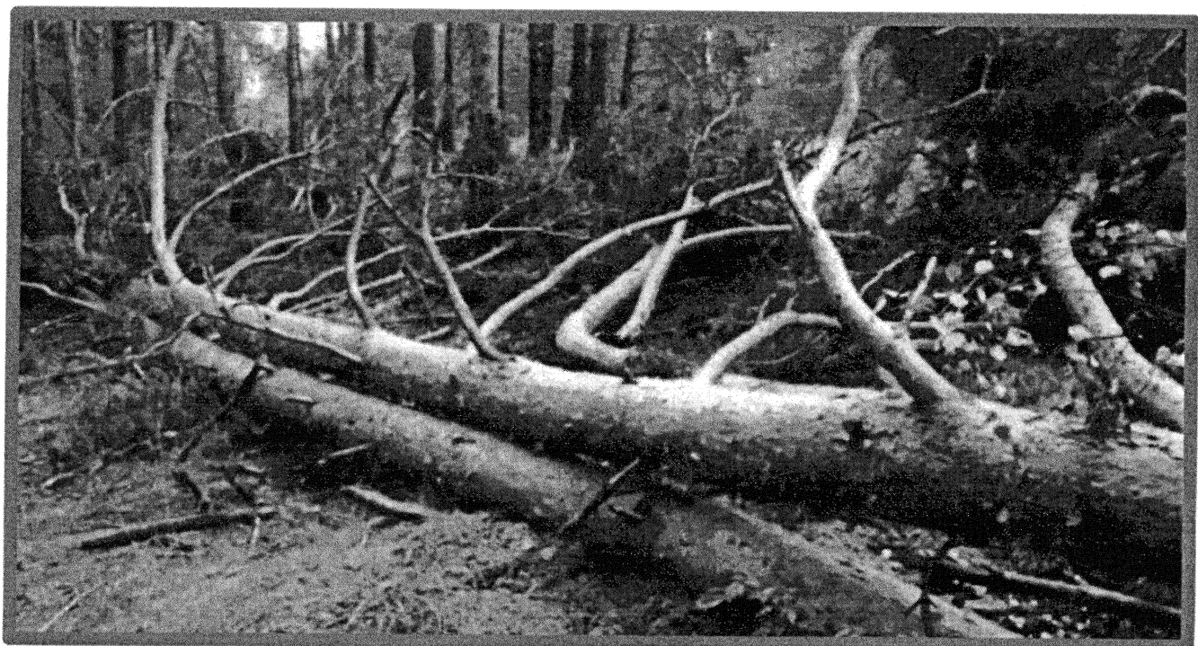
Лежащее на поверхности земли ветровальное дерево, не имеющее признаков отмирания. Не является валежником

Кроме того, необходимо обратить внимание, что деревья, которые лежат на земле, но не имеют признаков естественного отмирания (имеют зеленую листву или хвою), определять как «мертвые» не допускается (смотри изображение № 5).