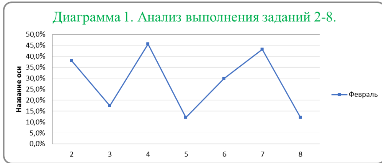
Диаграмма 1. Анализ выполнения заданий 2-8.