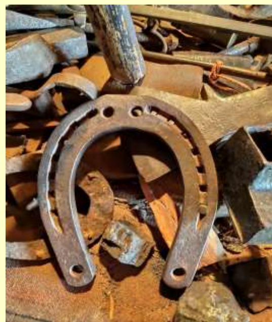
Кузница мызы Палмзе

“Сотрудничество в рамках проекта будет способствовать социально-экономическому развитию приграничных территорий России и Эстонии”