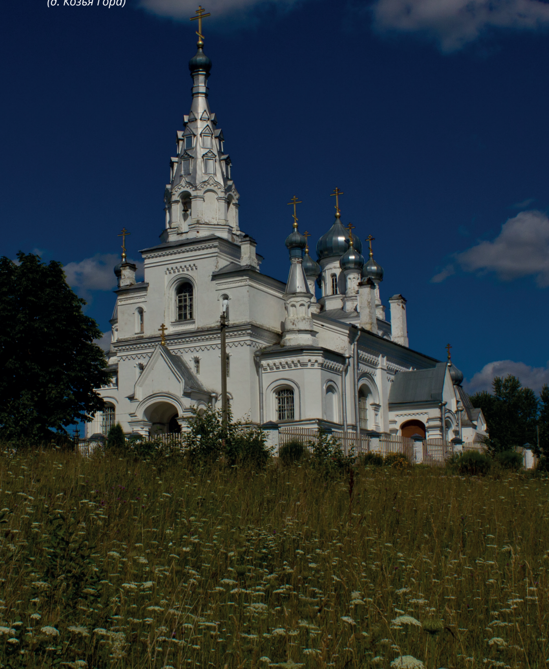
Церковь Покрова Пресвятой Богородицы (д. Козья Гора)